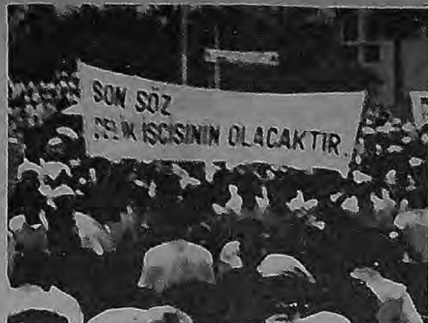
Bugün gelner noktada, Çelik işçisi, 137 gün süren

ne kadar sendikamız ciddi bir üye kaybına uğramamış, buna mukabil 4500 üye kazanmıştır. Buna rağmen, 137 gün süren yasal grevimizin niteliğini almak isteyen siyasi iktidar düzmece belge ve rakamlarla sendikamızı %10 barajının altına düşürdü. Siyasi iktidar, baskı ile bizleri sendikamızdan ayırmak ve sözleşmesiz bırakmak istiyoruz. ÇELİK-İŞ SENDİKASI BARAJIN ALTINA DA DÜŞÜRÜLE, BİZLERE BASKI VE TEHDİT DE YAPILSA SENDİKAMIZDAN AYRILMAMAYA KARARLIYIZ. Ancak, Çelik-İş Sendikası'na üye 22 bin Demir-Çelik işçisi ile özel sektörde çalışan 28 bin işçi %10 barajı sebebi ile toplu sözleşmesiz kalmaktadır. Ağır şartlarda çalışan 50 bin işçi ve aileleri ile 200 bin insanı ilgilendiren bu haksızlığın önlenmesi için sendikamızın YÜCE MAKAMINIZA SUNDUĞU DAVA DOSYASININ DİKKATLE İNCELENEREK ADIL BİR KARAR VERECEĞİNİZDEN HİÇBİR KUŞKUMUZ YOKTUR. ADALETİN EN YÜKSEK ORGANI OLAN YARGITAY'IN, SİYASİ İKTİDARIN BASKILARINA BOYUN BÜKMEYEN ADIL KARAR VERECEĞİNE İNANIYORUZ. Saygılarımızla,