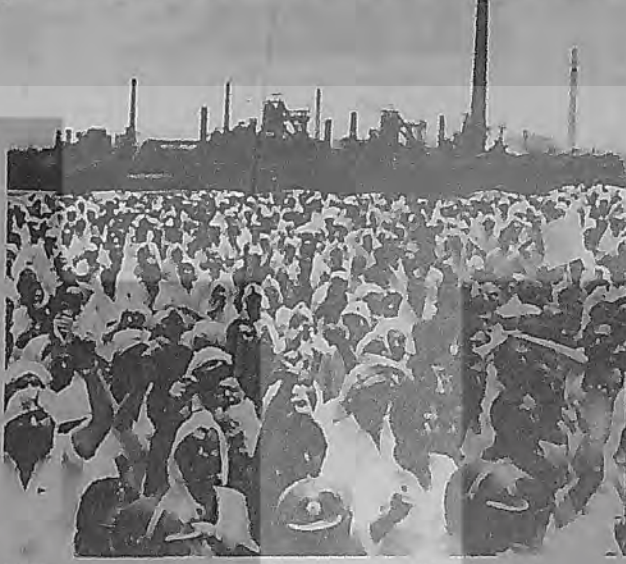
MESS yöneticilerinin arkasında Cumhurbaşkanı, hükümet ve uluslararası sermayenin qucu var. Ya katıldınız?

Loş bir oda, slayt, çizelgeler, istatistikler ve bunları açıklayan MESS görevlisi. Sendikalar tarafından ses-soluk yok. Ve MESS'in "gerçekleri": "...Ölkemizde 22 milyon çalışan vardır. Bunun 3,5 milyonu sigortalı, sigortalı olan işçilerin 2,5 milyonu sendikalı. 22 milyon çalışanların sendikası oranı %9,5'dir. Yani, sendikalı olanlar genel içinde azınlıktadır. Aynı zamanda bu azınlık, tüm çalışanlara ödenen miktar içinde aldığı pay %80'dir. Geriye kalan büyük çoğunluk (%90,5) genel işçi giderlerinden ancak %20 pay almaktadır!"