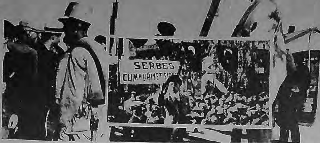
Devrimin kuralı işledi. Küçük burjuva diktatörlüğünün İstiklal Mahkemeleri, Kemalist devrim kadroları arasında doğan muhalefeti bastırdı. Milli kurtuluşçular, bir başka milli kurtuluş talebini milli kullarıyla bastırdılar. Resmi tarihini temellendirdi. Muhalefeti denetim altına almak için 'kurduruldu' SCF bir muhalefet ödeğine dönüşünce kendisini 'kapattı'.

Sürecin, bu noktaya kadar üzerinde durulması gereken konuları, devrim ve karşıdevrim çatışması olduğu kadar, küçük burjuvazinin diktatörlük koşullarında devrimin yasasının da amacısızca işlemiş olmasıdır. Devrimin yasası, kendi içine döndüğünde, tasfiye anlamına geldi. Küçük burjuva önder kadrolar arasında program hedefleri ve izlenince yol konusunda anlaşmazlıkların yol açtığı çatışmalar, yeni meclis kazanımla başlayan Kemalizm ile eski İttihatçılık çelişmesi biçiminde odaklaştı. Mustafa Kemal ve eski İttihatçılar arasındaki kopuş gerçekleş-