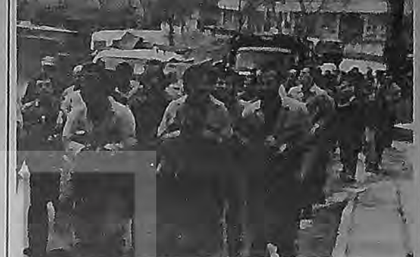
Otomobil-İş üyesi 360 işçinin çalıştığı Şişecam Makina Kalıp Sanayi A.Ş. çalışanlarının sabah vardığında bulunan 100'e yakın bir bölüme, üst sendikaların MESS'e karşı aldığı eylem kararını fabrika dışında 100 metrelik bir yürüyüşle ve yemek boykotuyla verna getirdiler. İşçiler, üst sendikaların ortak bildirisini okunarak bildirdiği eylemde her vardırımda tekrarlama ve MESS'in davatıldığı teslimiyete karşı çıkmak konusunda kararlı kararlı belirttiler.

10 Ekim'de Çelik-İş, Otomobil-İş, Özdemir-İş sendikalarına bağlı 171 işverinde çalışan 50 bin işçi MESS'in sözleşmedeki tutumunu protesto etmek için yemek boykotu yaptı. Üst sendikaların ortak açıklamasında yemek boykotunun ardından bir dizi eylem paketi hazırlandı. MESS'in sözleşme görüşmelerindeki teklif dahi vermemesi ve sözleşmeye uyuşmazlığa sokma tavırını protesto için ilk eylem olarak gerçekleştirilen yemek boykotunun ardından, değişik protesto biçimleri ve bölgesel toplantılar düzenlenmesi kararlaştırıldı. İlk Bölgesel toplantı 6 bin işçinin katılımıyla gerçekleştirildi. Gebze'deki ilk bölgesel toplantıda sözleşmede gelinen son durum değerlendirildi ve "birleşme" konusuna vurgulandı. "Birleşme"nin en geç Kasım ayında gerçekleştirilmesi öngörüldü. Toplantı sonrasında, işçiler Gebze için Heykeli'ne kadar yürüdürek, "hükümet istifa", "savasa hayır", "işçilerin birliği MESS patronları yenecek" sloganlarını attılar.