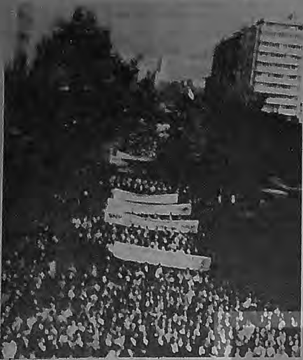
Bitmedi bu kavga sürüyor ve sürecek. Yeryüzü aşkın yuzu oluncaya dek

ler hep meçhul(!) kaldı. Bu cinayetlerin ortak özelliğinde de, konjektürde, derinleşmekte olan ekonomik ve politik kriz dönemleriyle, cinayetlerin arkasından gelen, toplumsal muhalefete ve devrimcilerle yönelik saldırılar yer almakta. Bunun içindeki, Özal: "Teröristleri yasatmamamız lazım" diyor. Hedef artık her zamanki gibi toplumsal muhalefet ve devrimcilerdir. Ve "VUR EMRİ" de verilmiştir.